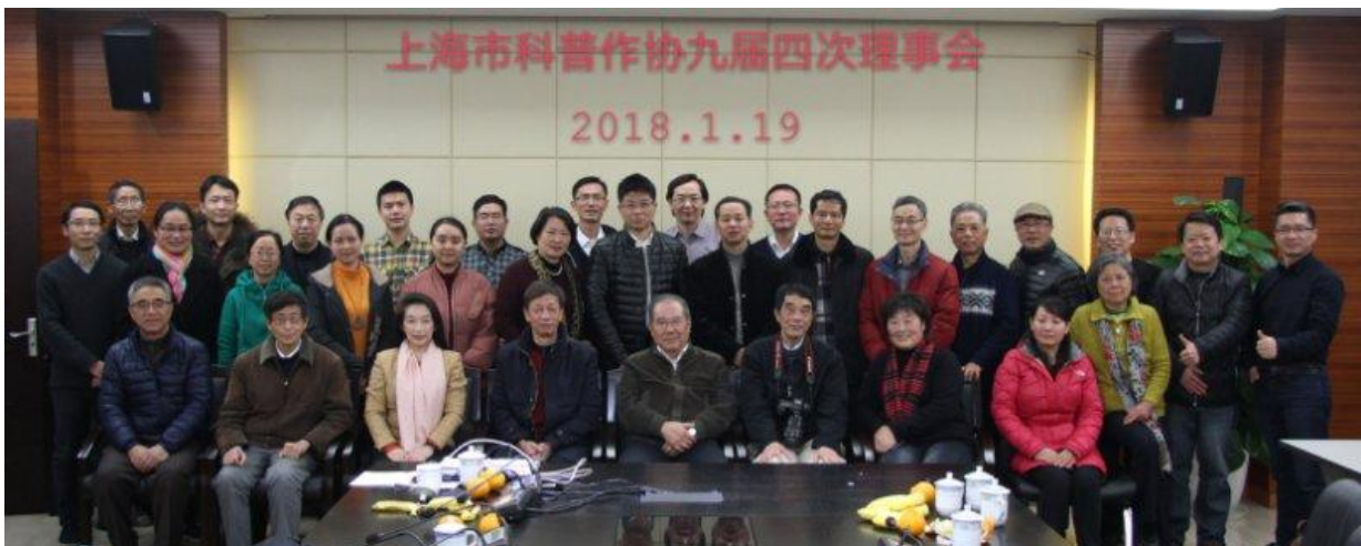
上海市科普作家协会九届四次理事会和会员迎春联谊会 2018 年 1 月 19 日在上海教育报刊总社举行。